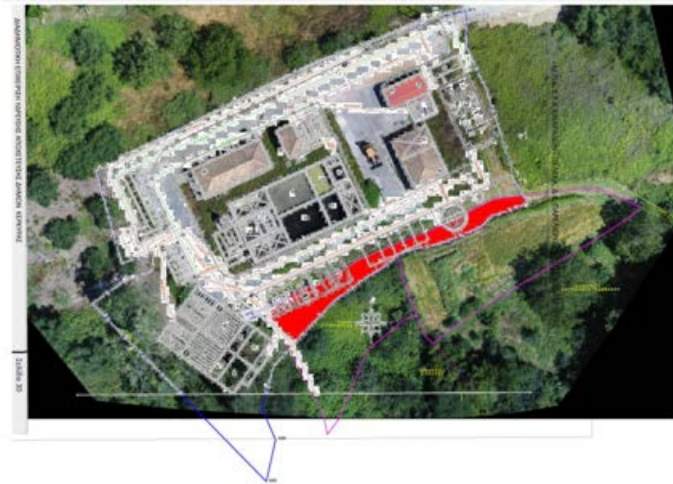
ΕΙΚΟΝΑ ΜΕΣΑ ΑΠΟ ΚΑΤΑΠΑΤΗΜΕΝΟ ΧΩΡΑΦΙ – ΕΜΦΑΝΗ ΟΡΙΑ