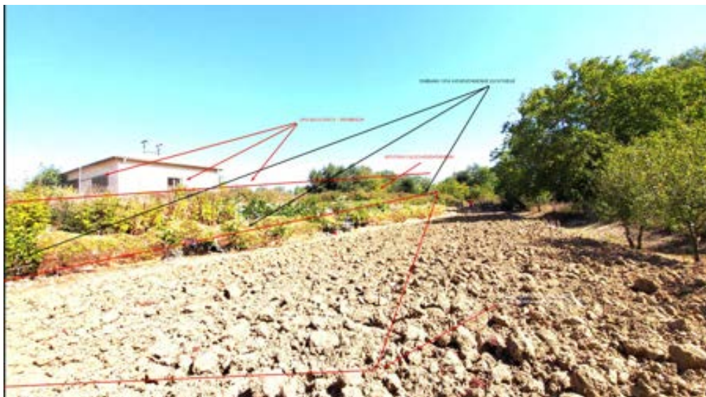
ΕΡΓΑ ΙΟΥΝΙΟΣ 2023 – ΠΑΡΑΝΟΜΩΣ ΔΙΕΞΑΓΩΜΕΝΑ ΕΝΤΟΣ ΤΟΥΡΙΣΤΙΚΗΣ ΠΕΡΙΟΔΟΥ