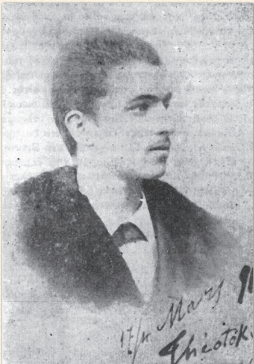
Ο Κ. Θεοτόκης στη Βενετία (1891).