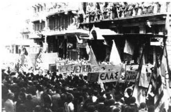
12 Οκτώβρη 1944, η απελευθέρωση της Αθήνας

Πολλοί λαοί της Ευρώπης γιορτάζουν την ημέρα αυτή σαν μέρα μνήμης αποδίδοντας φόρο τιμής στους αγώνες των ανθρώπων αυτών που όρθωσαν το ανάστημά τους, πάλεψαν και νίκησαν το τέρας του φασισμού.