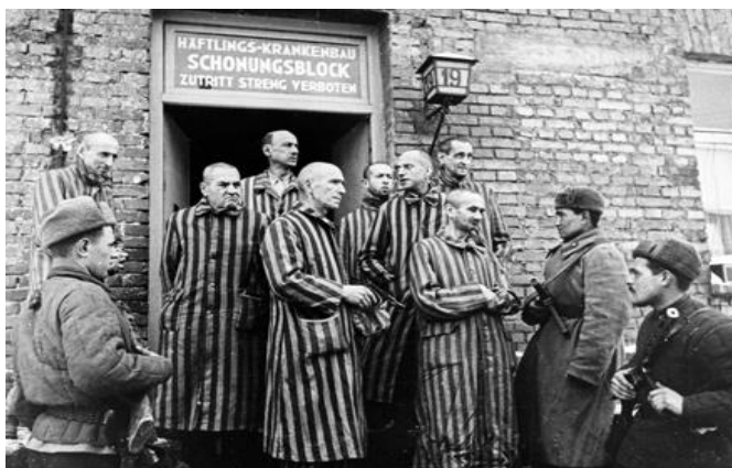
Σοβιετικοί απελευθερώνουν το Άουσβιτς

Η Γερμανία του Χίτλερ υπογράφει την άνευ όρων συνθηκολόγηση και υψώνεται στο Ράιχσταγκ η κόκκινη σημαία. Μια επέτειος που έγινε γνωστή ως «η μέρα της αντιφασιστικής νίκης των λαών»