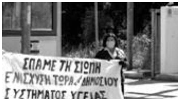
Κινητοποίηση στο Νοσοκομείο στις 7/4/2020

Είχαμε 560 κλίνες ΜΕΘ , πριν την πανδημία, ενώ σύμφωνα με τον πληθυσμό μας, σε κανονικές συνθήκες, πρέπει να έχουμε 2.000 κλίνες ΜΕΘ και 1.500 κλίνες ΜΑΦ (αυξημένης φροντίδας). Σ' αυτό το διάστημα ετοίμασαν μόνο 120 ΜΕΘ ακόμα, που όμως δεν έχουν το απαραίτητο προσωπικό. Δεν επέταξαν τις ιδιωτικές ΜΕΘ, αλλά χρυσολήρωσαν τις ιδιωτικές κλινικές.