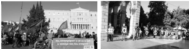
Άμεσα κινητοποιήθηκαν φορείς και νεολαία...

Εν μέσω πανδημίας και εντελώς στα μουλωχτά η κυβέρνηση της ΝΔ κατέθεσε τον «Αρμαγεδδώνα για το περιβάλλον», όπως έχει χαρακτηριστεί από το σύνολο των περιβαλλοντικών οργανώσεων το σχέδιο νόμου που συζητήθηκε στην ολομέλεια της βουλής.