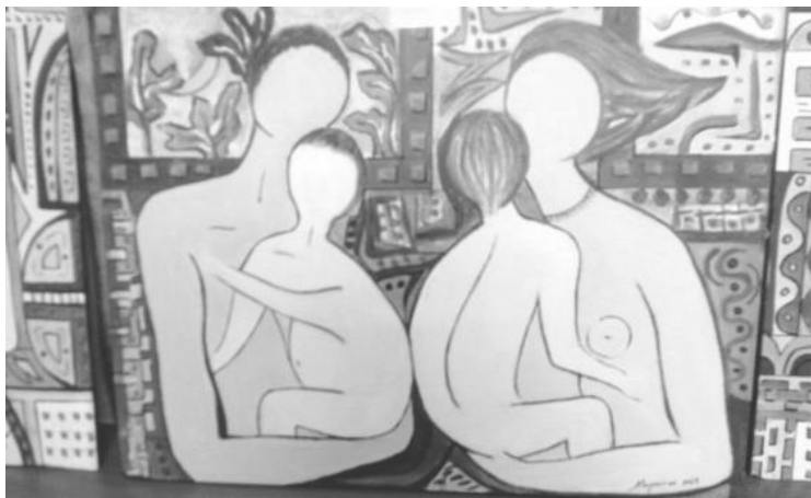
πίνακας της Ανθούλας Μωραΐτου