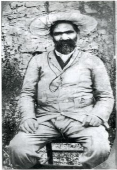
Ο Σταύρος Καλλέργης

Η Εργατική Πρωτομαγιά στη χώρα μας γιορτάστηκε για πρώτη φορά στις 2 Μαΐου 1893, μπροστά στο Καλλιμάρμαρο Στάδιο με οργανωτή τον Σταύρο Καλλέργη και τον Κεντρικό Σοσιαλιστικό Σύλλογό του, εφαρμόζοντας την απόφαση της Β' Διεθνούς στο Παρίσι, το 1889.