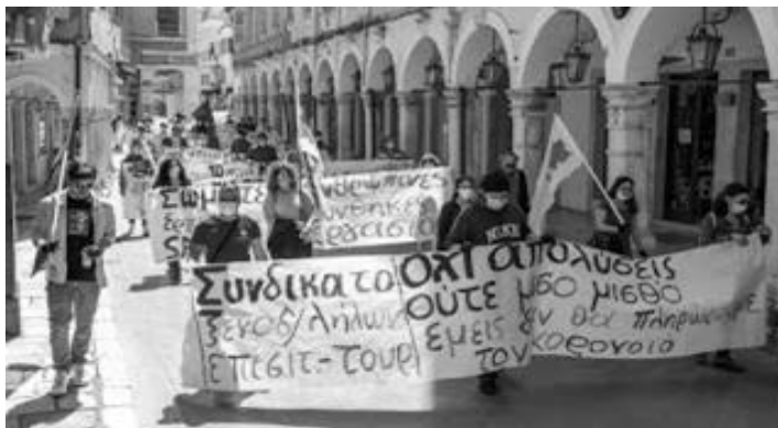
Από την Πρωτομαγιάτικη απεργία

Οι εποχικοί εργαζόμενοι και οι ελαστικά απασχολούμενοι πληρώνουν, ακόμη και στην εποχή των κερδών, πρώτοι το μάρμαρο, με προσαρμογή όλης τους της ζωής στις επιταγές των επιχειρηματικών ομίλων.