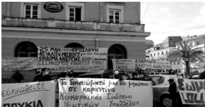
Κινητοποίηση στον ΟΑΕΔ 28/4/2020

Δεν αφήνουμε να μας ρίξουν στα αζήτητα , μέχρι να πάρει μπροστά η μηχανή του πανάκριβου εμπορεύματος που λέγεται τουρισμός, από τον οποίο, έτσι κι αλλιώς, είναι αποκλεισμένη η πλειοψηφία του λαού.